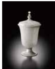
▲レース・グラス蓋付ゴブレット 16世紀末-17世紀初 ヴェネチア