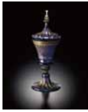
▲点彩花文蓋付ゴブレット 1500年頃 ヴェネチア