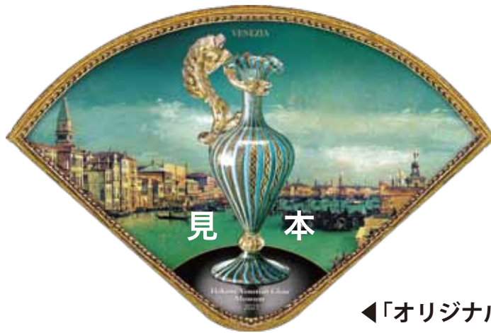
◀「オリジナル扇子形」入館チケット