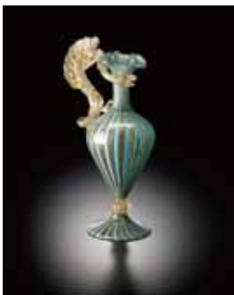
▲主要作品「龍装飾水差」 (19世紀、ヴェネチア)

装飾性豊かなヴェネチアン・グラスをあしらったオリジナル扇子で優雅に「涼」を感じていただきながら、特別企画展はじめ美術館のイベントをお楽しみください。