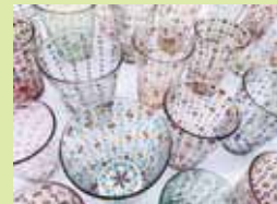
●『鹿の子豆グラス』 7,920~22,000円(税込)