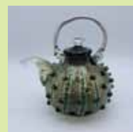
『ゴジラあられ注器』 110,000円(税込)