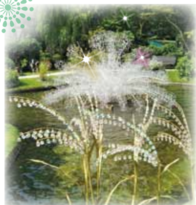
▲クリスタルガラスのススキと水上花火の競演