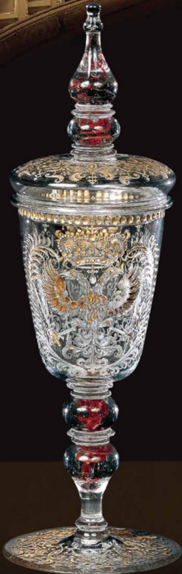
双頭の鷲文蓋付ゴブレット 18世紀前半 ポヘミア 町田市立博物館所蔵