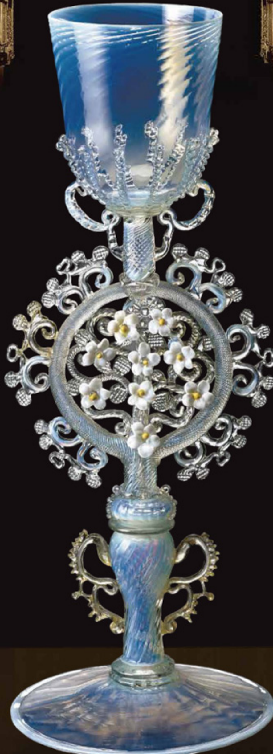
花装飾脚オパールセント・グラス・ゴブレット 1880年頃 ヴェネチア 箱根ガラスの森美術館所蔵