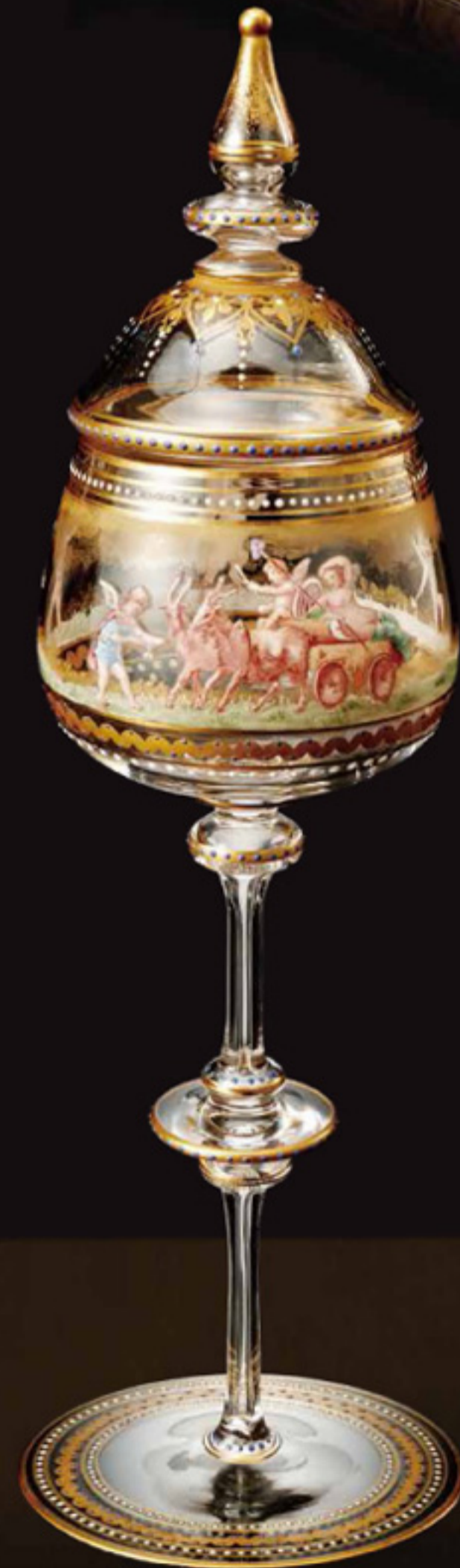
エンジェル文蓋付ゴブレット (オールド・バカラ) 1870~1910年頃 ロレーヌ地方 井村美術館所蔵