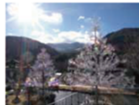
太陽と風で七色に輝く

展示期間：展示中~2024年1月8日(月・祝)まで クリスタルガラスの粒数： 大(ロミオ) 約8万5千粒 高さ：11m 小(ジュリエット) 約6万5千粒 高さ：8m