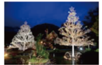
夕暮れ時はライトアップされ、幻想的に輝く