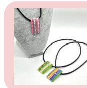
「ミルフィオリ・グラス ネックレス」 19,800円(税込) ペンダントトップ:縦約5cm×横約3cm

ガラスのフラワーギフトのようなアクセサリはいかがでしょうか。ヴェネチアの老舗工房「ERCOLE MORETTI」製。伝統的な技法で「千の花」を意味するミルフィオリ・グラスは、装いに優しい華やかさを添えてくれるアイテムです。