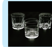
「スピントムブラー」 12,100円～13,200円(税込) 高さ約9.5cm×直径約9cm

こだわり派のお父さんには、職人技の光るユニークなプレゼントがおすすめ。マイスターの集う国ドイツから取り寄せたこのタンブラーは、底に仕掛けられた特殊な構造によりコマのように安定して回ります。きらびやかなクリスタルガラスに施された計算されたカッティング・デザインが、特別な時間を演出します。