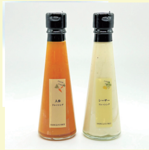
◀左「人参ドレッシング」(160ml) 780円(税込) ◀右「シーザードレッシング」(150ml) 880円(税込)

サラダが食卓の主役に。うかいグループ総料理長が監修した味わい深いドレッシングです。シーザードレッシングは3種のチーズのkokoroにアンチョビやニンニクのアクセントを加えた、濃厚でありながらバランスのとれた風味。どんな具材のサラダとも相性抜群です。人参ドレッシングは人参の素材感が存分に感じられるよう、隠し味に白だしと醤油を入れ日本人に馴染みのある味わいに仕上がっています。旬の野菜と一緒に、うかいの味をご家庭でもお楽しみください。